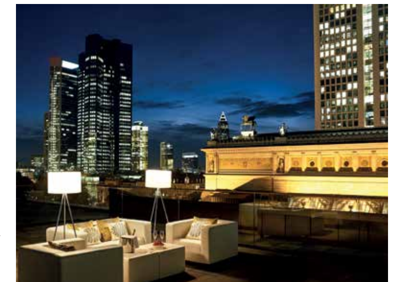
Presidential Suite - Roof Top Terrace

Le Marais, auf der "Mezzanine", ist das Schmuckstück unserer Tagungs- und Banketträumlichkeiten. Der außergewöhnliche Ballsaal überzeugt durch seine großzügigen 320 Quadratmeter und ist der perfekte Ort für außergewöhnliche Events. Hier können bis zu 200 Gäste in herrschaftlichem Ambiente durch die Nacht tanzen und träumen. Mit seinen Glasdächern, die den Saal mit Licht fluten, ist Le Marais ein exklusiver Veranstaltungsort für Seminare, Konferenzen, Zeremonien oder Produkteinführungen.