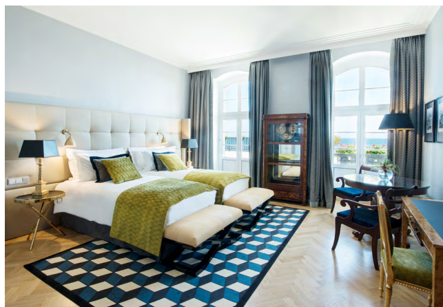
Apartament Prezydencki im. Charles de Gaulle

WYPOSAŻENIE • Bezpłatny dostęp do sieci Wi-Fi • Ekspres do kawy Nespresso • Nagłośnienie Bose© • LED HD TV • Sejf • Minibar