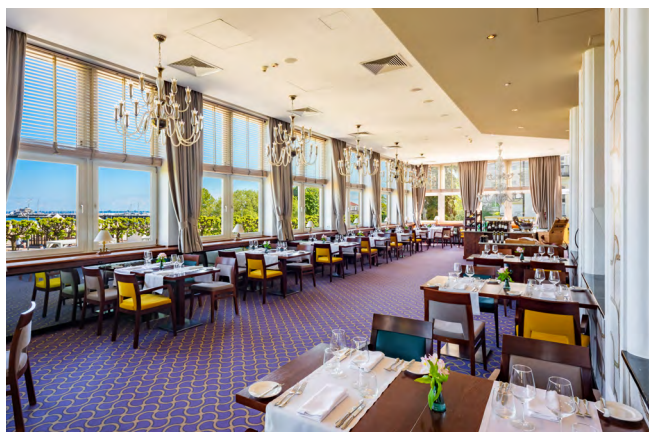
Restauracja Grand Blue

Zachwycające miejsce nad brzegiem Bałtyku, gdzie monumentalny styl łączy się w harmonii z francuską sztuką życia .