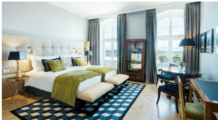
Apartament Prezydencki im. Charles de Gaulle

Wyposażenie • Bezpłatny dostęp do sieci Wi-Fi • Ekspres do kawy Nespresso • Nagłośnienie Bose® • LED HD TV • Sejf • Minibar