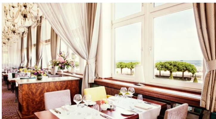
Restauracja Grand Blue

ZACHWYCAJĄCE MIEJSCE NAD BRZEGIEM BAŁTYKU, GDZIE MONUMENTALNY STYL ŁĄCZY SIĘ W HARMONII Z FRANCUSKĄ SZTUKĄ ŻYCIA.