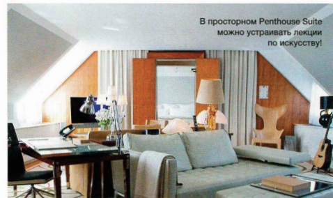
В просторном Penthouse Suite можно устраивать лекции по искусству!