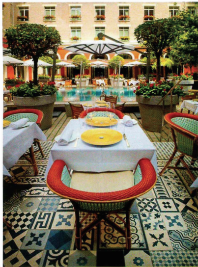
В Le Royal Monceau, Raffles Paris полно ярких деталей и арт-объектов, причем не только внутри здания