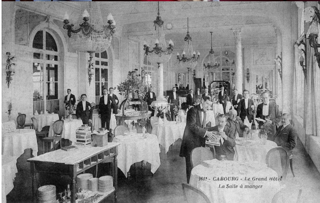
Le restaurant Le Balbec, de nos jours et en 1907