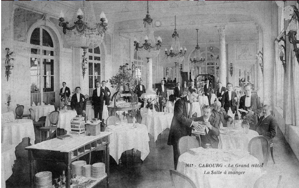
Le restaurant Le Balbec, de nos jours et en 1907