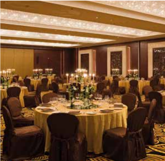
Weddings at Monte Carlo Ballroom

بجانب حمام السباحة المطل على البحر، تقدم دبي أفضل مناظر غروب الشمس على الخليج العربي. ويعد هذا المكان مثاليًا لتنظيم حفلات الزفاف الحاملة أو أي احتفالية أخرى.