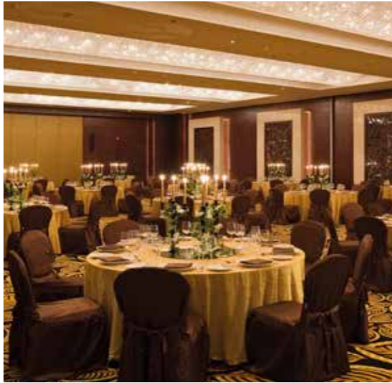
Weddings at Monte Carlo Ballroom

بجانب حمام السباحة المطل على البحر، تقدم دبي أفضل مناظر غروب الشمس على الخليج العربي. ويعد هذا المكان مثاليًا لتنظيم حفلات الزفاف الحاملة أو أي احتفالية أخرى.