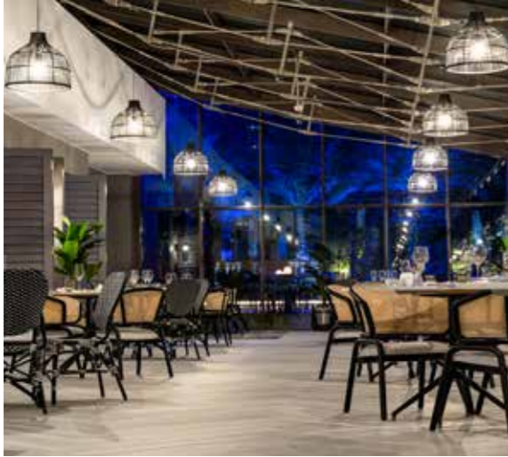
Dinner at Plantation Brasserie