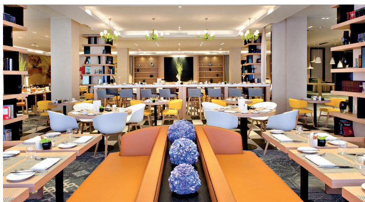
Restauracja Kitchen Gallery

POŁĄCZENIE NOWOCZESNEGO DESIGNU Z KLASYCZNĄ FRANCUSKĄ ELEGANCJĄ W SAMYM SERCU WARSZAWY