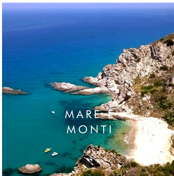
MARE E MONTI