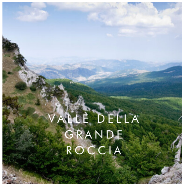
VALLE DELLA GRANDE ROCCIA