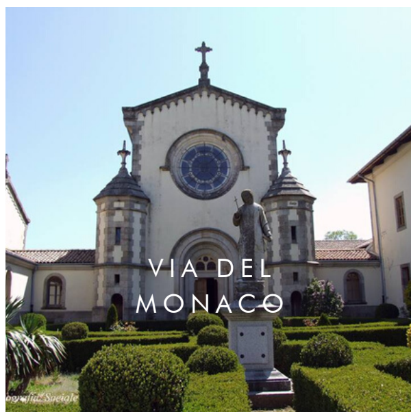
VIA DEL MONACO